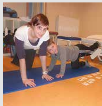
Bobath-Therapie - individuell angepasste Therapieziele.