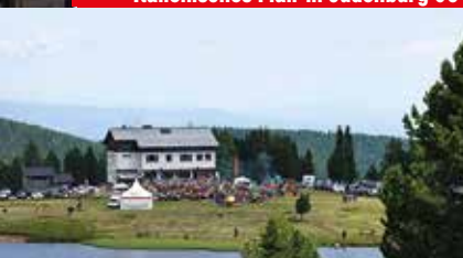
Alm-Kirtag auf der Winterleiten 09