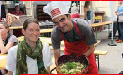
Haus Murtal lud zum Sommerfest 18