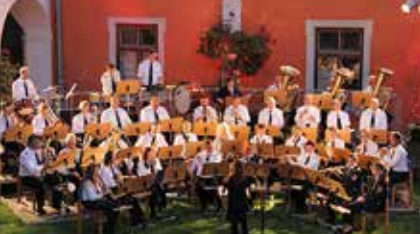
Sommerkonzert der Stadtkapelle 05