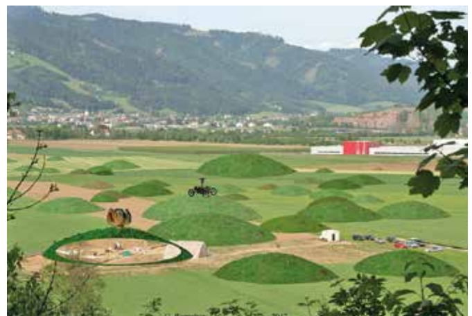
G. Ranacher: Haben die Hügelgräber am Fuße des Falkenbergs in der Hallstattzeit vielleicht so ausgesehen?

Dank einer Subvention des Lionsclubs Judenburg-Knittelfeld und einiger Sponsoren ist es möglich, einen Teil der Kosten dieser rund 100-seitigen Publikation abzudecken. Sie wird Anfang September erscheinen und zum Preis von EUR 12,90 u.a. im Stadtmuseum Judenburg, im Bürgerservice und im Tourismusbüro der Gemeinde Judenburg, im Sternenturm sowie im Weltladen am Hauptplatz erhältlich sein.