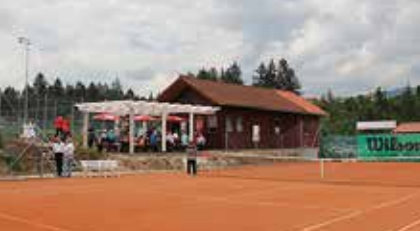
TC-Judenburg - ein neues Zuhause 17