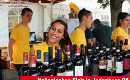
Italienisches Flair in Judenburg 06