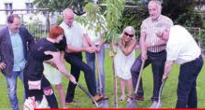
10 Jahre Mobile Dienste 19