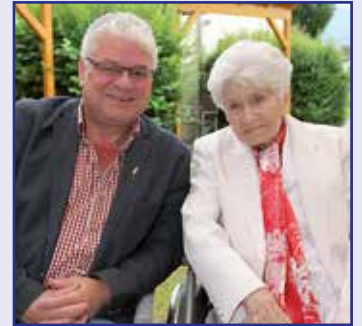
Maria Suede 100 Jahre