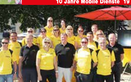
111 Jahre Stadtwerke Judenburg AG 11